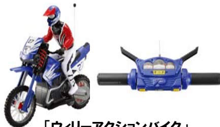
「ウィリーアクションバイク」 10月発売 ¥12,390 ※グループ子会社(株)タイヨーより発売