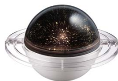
「ホームスターSpa」 9月発売 ¥7,140