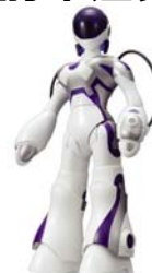
「エマ」 9月発売 ¥18,900