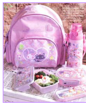
学童用品、化粧雑貨 SHO-BI(株)より発売予定