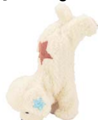
「さかだちラッキー」 8月発売 ¥9,240