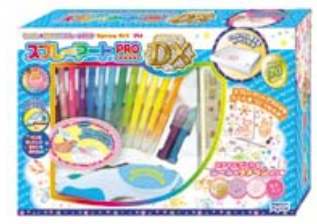
「スプレーアートPRO DX」 10月発売 ¥6,300