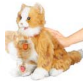
「夢ねこハート」 10月発売 ¥10,290