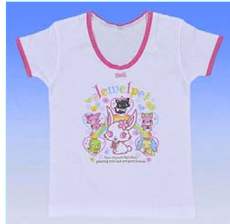
アパレル (株)バンダイより発売中