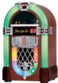
「ホームジュークボックス」 10月発売 ¥29,400