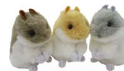
「夢ハムスター」 8月発売 ¥1,260