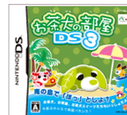
「お茶犬DS3」 ※エム・ティー・オー(株)より5月発売 ©2008 MTO Inc. ©SEGA TOYS / HORIPRO