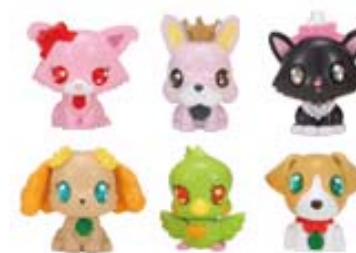
「魔法のジュエルコレクション」(フィギュア) 10月発売 各 ¥714

専用サイトで「うえぶぐるみ」の付属カードの番号を入力すると、仮想空間(ジュエルランド)に「うえぶぐるみ」と同じキャラクターがペットとして登場し、自分と一緒に魔法生活を楽しめます。