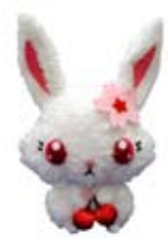
ジュエルペット「うえぶぐるみ」 10月発売 ¥2,940 ©2008 SANRIO/SEGATOYS.