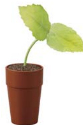
「ペコツぱ」 9月発売 ¥2,310