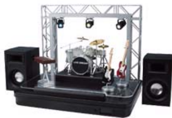
「ライブドリーム」 10月発売 ¥21,000