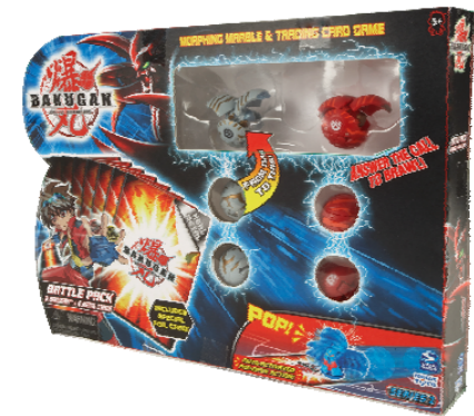
2-Player Battle Pack SRP $24.99