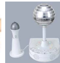
「おうちでヒトカラ」 12月発売 ¥7,140 ※(株)セガと共同プロ モーション展開中