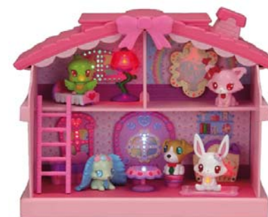
「光りかがやく★魔法のジュエルハウス」 10月発売 ¥5,040