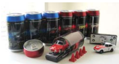
「ラジカン プレミアム ミニ」 グループ子会社(株)タイヨーより発売 ¥1,890(税込)