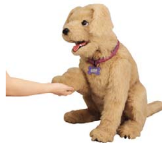
「夢いぬDX ゴールデン レトリバー」 9月発売 ¥34,650