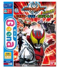
「仮面ライダーキバ ひらがな・すうじ・ちえバトル!!」 7月発売 ¥7,245 ©2008 石森プロ・テレビ朝日・ADK・東映 BANDAI2008