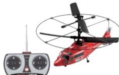
「マイクロマスターHG3」 (株)タイヨーより7月発売 8月発売 ¥10,290(税込)