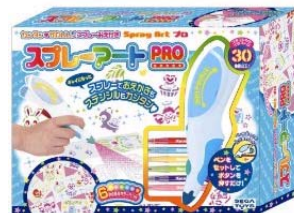
「スプレーアートPRO」 7月発売 ¥3,150