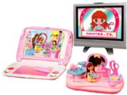
「おしゃれビーナ」7月発売 ¥7,245