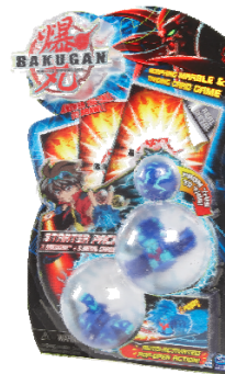
Starter Pack SRP $15.99