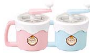
「くるりんアイスクリン」 7月発売 ¥7,140