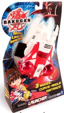
Launcher SRP $15.99