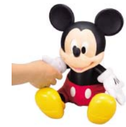
「フレンドオブフレンズ / ミッキーマウス」 10月発売 ¥13,440 ©Disney