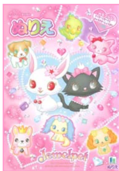
ステーショナリー (株)ショウワノートより発売中