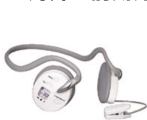
「カラダトレーナー」 5月発売 ¥5,775