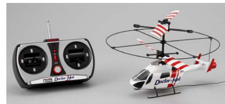
マイクロマスターHG3 ドクターヘリ 11月発売 税込¥10,290 ※(株)タイヨーより発売