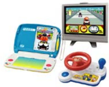
「アンパンマンドライブ」8月発売 ¥7,245 ©やなせたかし/フレーベル館・TMS・NTV