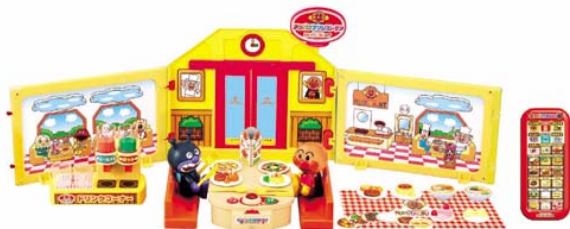
「アンパンマンレストラン ごちゅうもんをどうぞ！」 8月発売 ¥9,975 ©やなせたかし/フレーベル館・TMS・NTV