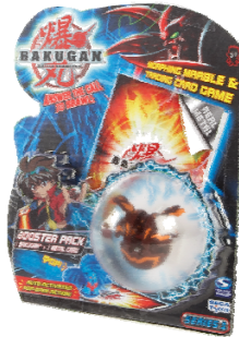
Booster Pack SRP $4.99