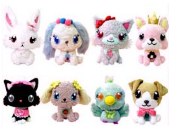
国内初の女兒向けWEB連動玩具「うえぶぐるみ」 10月発売 各 ¥2,940