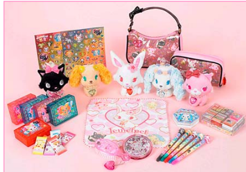
雑貨、ファンシー (株)サンリオより発売中