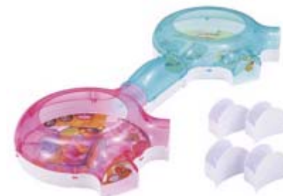
ハムスターの大きなお部屋 ¥2,625