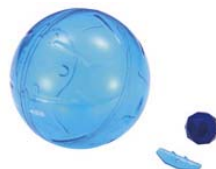
アドベンチャーボール ¥1,260