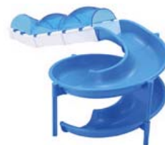
スライダー&レーン ¥1,890