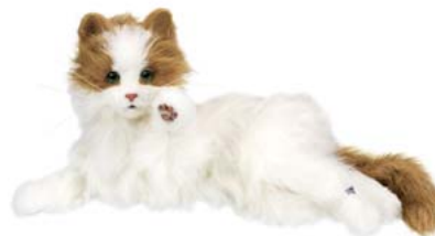
「夢ねこヴィーナス」 10,500円