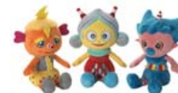
「モノランモノラン」 ぬいぐるみ 893円～