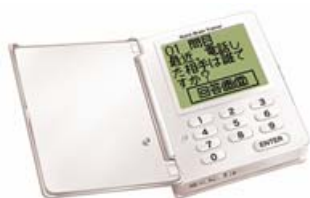
「脳カトレーニング機 即効脳トレ」 6,090円