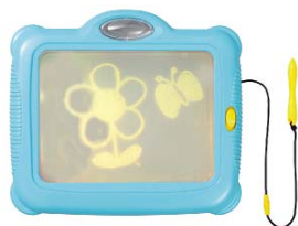
「なぞるおえかき ピカッとかけた!」3,570円