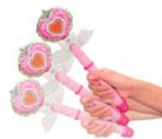
「ジュエルステッキ」 3,990円