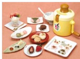
「つきたておもちゃ くるちんもっちゃん」 3,990円