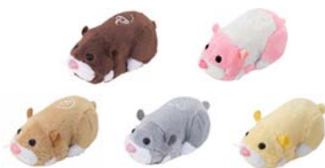
ハムスター単体 各¥1,050