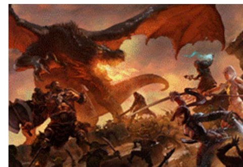
『Kingdom Conquest II』