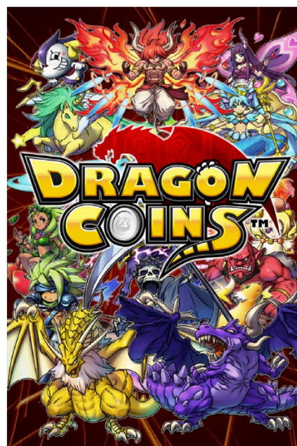
『ドラゴンコインズ』