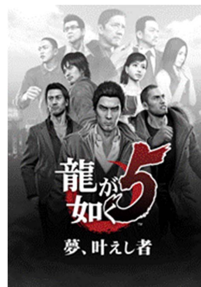
『龍が如く5 夢、叶えし者』