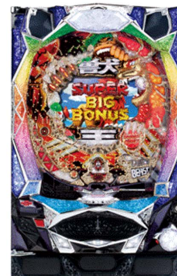
『ぱちんこCR神獣王』 (サミー)