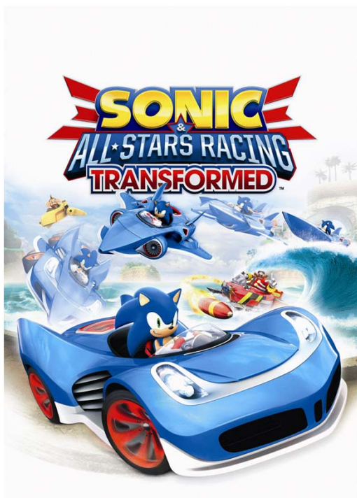
『Sonic & All-Stars Racing Transformed』