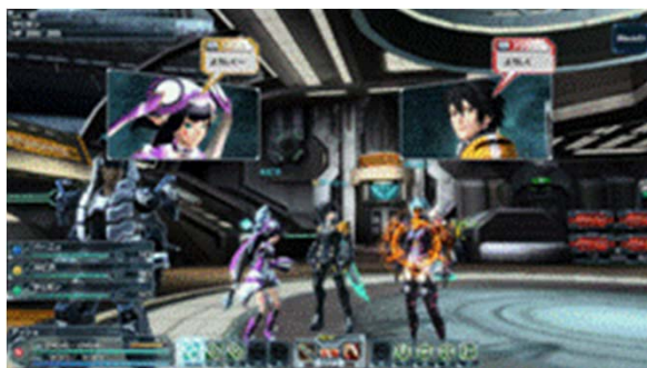
『ファンタシースターオンライン2』