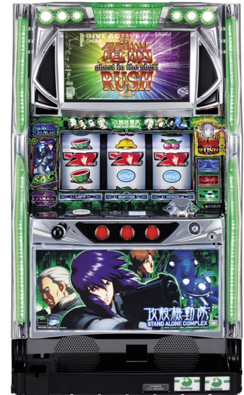
『パチスロ 攻殻機動隊S.A.C.』 (サミー)

©士郎正宗・Production I.G/講談社・攻殻機動隊製作委員会 ©Sammy