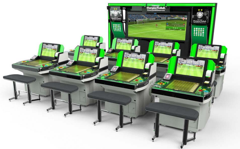
『WORLD CLUB Champion Football』シリーズ

©SEGA ©Panini S.p.A. All Rights Reserved