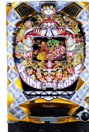
『CR米米CLUB 大収穫祭』 (タイヨーエレック) ©米GROUND ©TAIYO ELEC