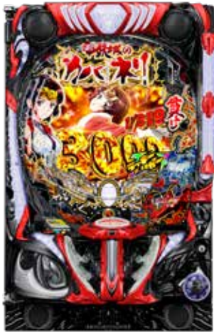
e甲鉄城のカバネリ2 咲かせや燦然