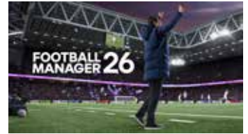
Football Manager 26 ©Sports Interactive Limited 2025. Published by SEGA.