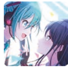
プロジェクトセカイ カラフルステージ! feat. 初音ミク © SEGA / © Colorful Palette Inc. / © Crypton Future Media, INC. www.piapro.net piapro All rights reserved.