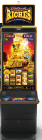
「Railroad RICHES」シリーズ © SEGA SAMMY CREATION INC.