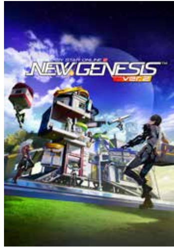
PSO2 ニュージェネシス ver.2 ©SEGA