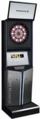
ダーツライブ3 ©DARTSLIVE Co., Ltd.