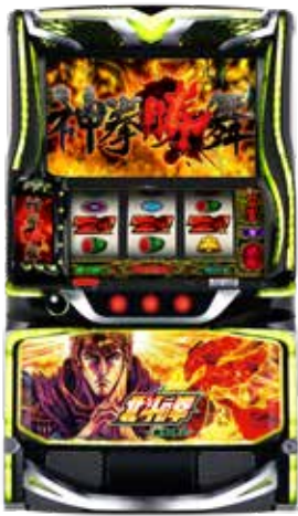
スマスロ 北斗の拳 転生の章2 ©武論尊・原哲夫/コアミックス 1983. ©COAMIX 2007 著作権許諾証YJN-815 ©Sammy