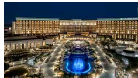
パラダイスシティ