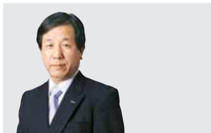
中山 圭史 取締役相談役

1980年 サミー工業(株)(現サミー(株))代表取締役社長 2003年 (株)サミーネットワークス取締役会長(現任) 2004年 (株)セガ代表取締役会長 サミー(株)代表取締役会長CEO (株)セガ代表取締役会長兼CEO 当社代表取締役会長兼社長(現任) 2005年 (株)セガトイズ取締役会長(現任) (株)トムス・エンタテインメント取締役会長(現任) 2007年 (株)セガ代表取締役社長CEO兼COO 2008年 (株)セガ代表取締役会長CEO(現任) 2012年 フェニックスリゾート(株)社外取締役 サミー(株)取締役会長 フェニックスリゾート(株)取締役 同社取締役会長(現任) (株)セガネットワークス取締役(現任) 2013年 サミー(株)代表取締役会長CEO(現任)