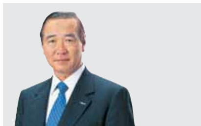
里見 治 代表取締役会長兼社長

1980年 サミー工業(株)(現サミー(株))代表取締役社長 2003年 (株)サミーネットワークス取締役会長(現任) 2004年 (株)セガ代表取締役会長 サミー(株)代表取締役会長CEO (株)セガ代表取締役会長兼CEO 当社代表取締役会長兼社長(現任) 2005年 (株)セガトイズ取締役会長(現任) (株)トムス・エンタテインメント取締役会長(現任) 2007年 (株)セガ代表取締役社長CEO兼COO 2008年 (株)セガ代表取締役会長CEO(現任) 2012年 フェニックスリゾート(株)社外取締役 サミー(株)取締役会長 フェニックスリゾート(株)取締役 同社取締役会長(現任) (株)セガネットワークス取締役(現任) 2013年 サミー(株)代表取締役会長CEO(現任)