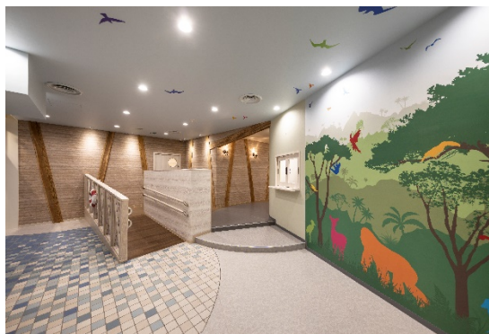
動物たちが出迎えるエントランス