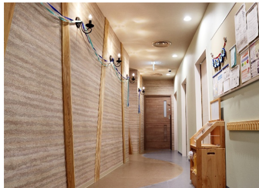
森へと続く洞窟をイメージした廊下