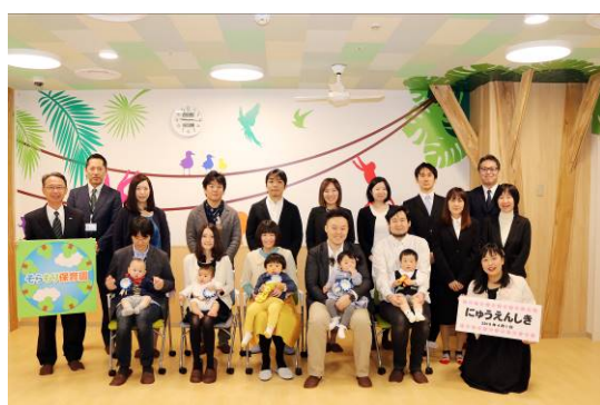
4月1日に実施した入園式