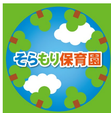
そらもり保育園ロゴ