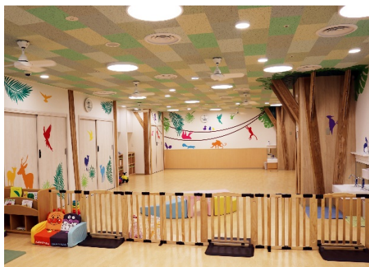
森をイメージした保育ルーム